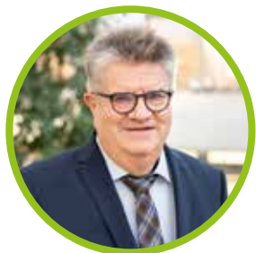
Ihr Oberbürgermeister Hubert Schnurr

Ich wünsche Ihnen viel Erfolg bei Ihrer Bewerbung.