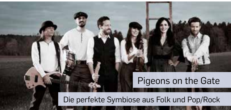
Pigeons on the Gate

Die Veranstaltung findet nur bei trockener Witterung statt.