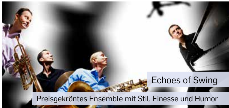
Echoes of Swing

Bei nasser Witterung im Bürgerhaus Neuer Markt (nur begrenzte Einlasszahl).