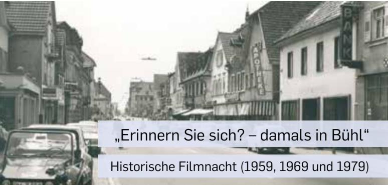
„Erinnern Sie sich? – damals in Bühl“

Bei nasser Witterung im Bürgerhaus Neuer Markt (nur begrenzte Einlasszahl).