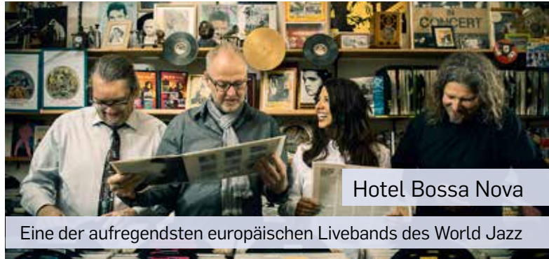
Hotel Bossa Nova

Bei nasser Witterung im Bürgerhaus Neuer Markt (nur begrenzte Einlasszahl).